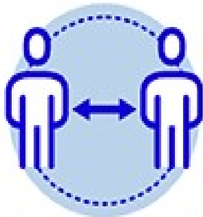
座席間隔を空ける